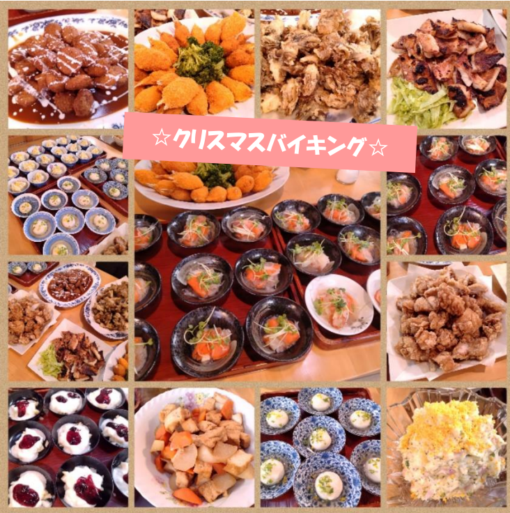
☆クリスマスバイキング☆