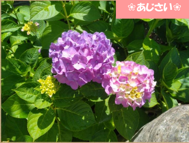
❁ あじさい ❁