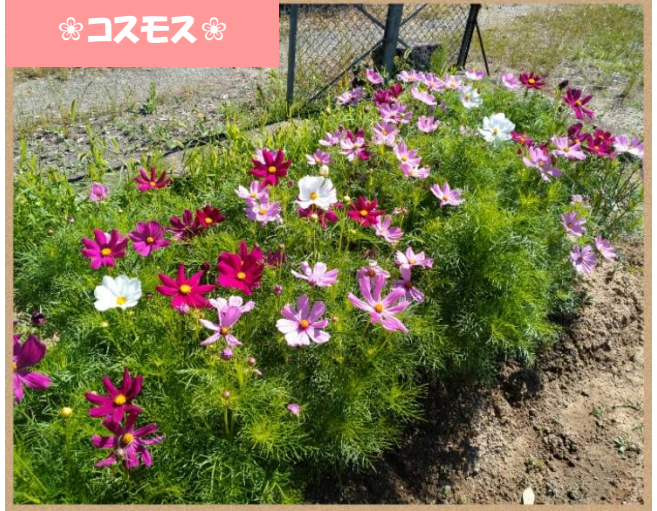
❁ コスモス ❁