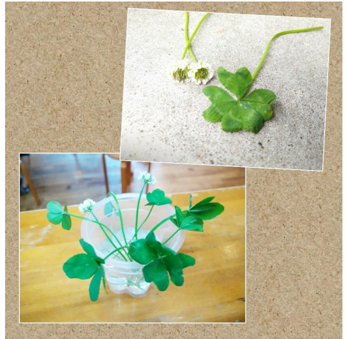
四葉のクローバーたくさん見つけました♪