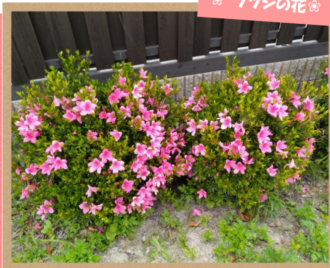
母の日のプレゼントが届きました